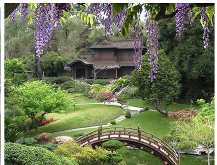
Taman kyoto,di Tokyo,Jepun.