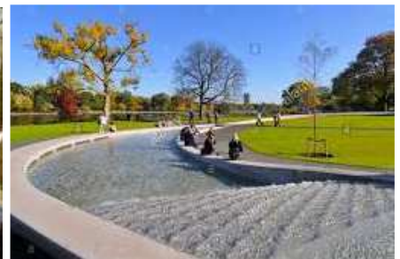
Hyde Park di London, di Britian