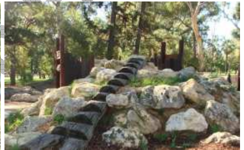
Kings Park and Botanic Garden di Perth, Australia.