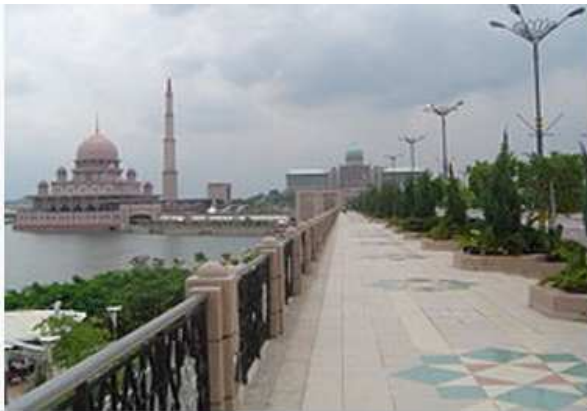
Wilayah Persekutuan Putrajaya Prang Besar