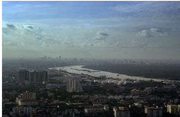
Bangunan-bangunan pencekar langit Bangkok, Thailand.