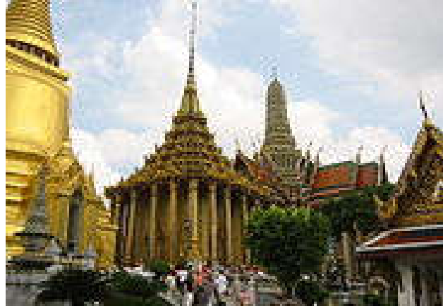
Bangunan-banguna tradisional Bangkok, Thailand.