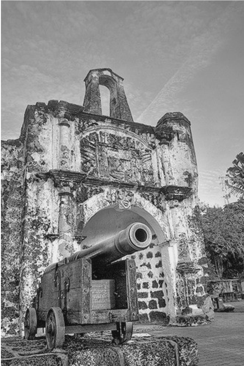
Gambar Bangunan Kota A'Famosa yang diambil dari pandangan hadapan